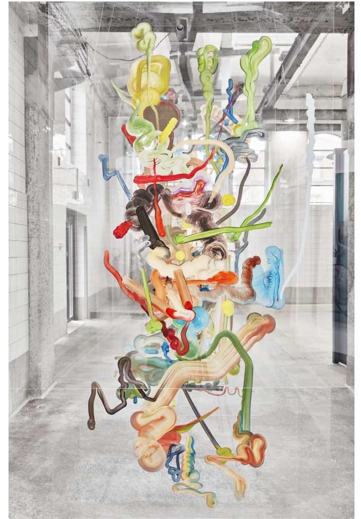
Vue de l'exposition Rhizome, Installation Plexiglas 4x 200/100 cm, 2021