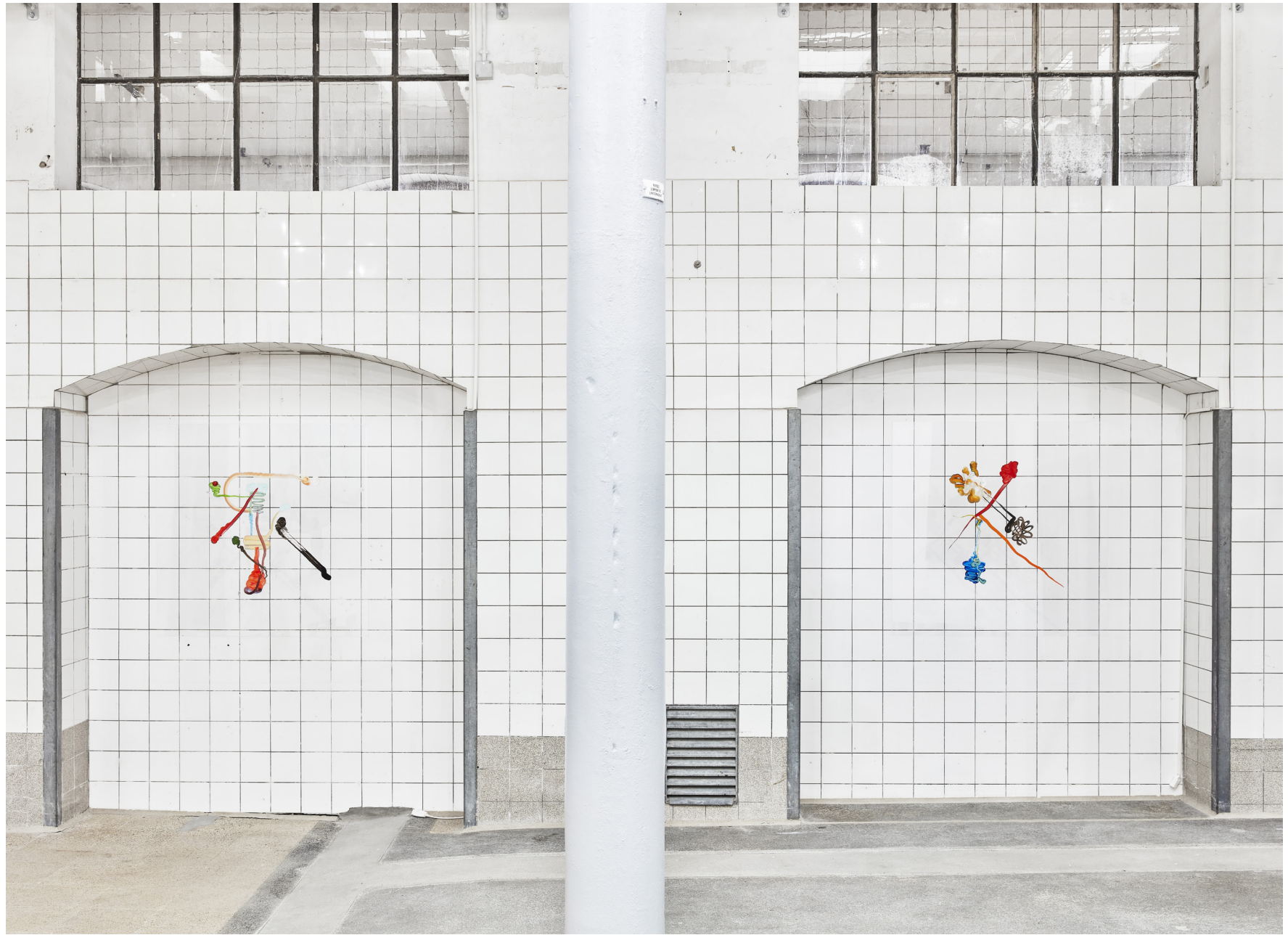
Plexiglas 2x100/100 cm, 2021