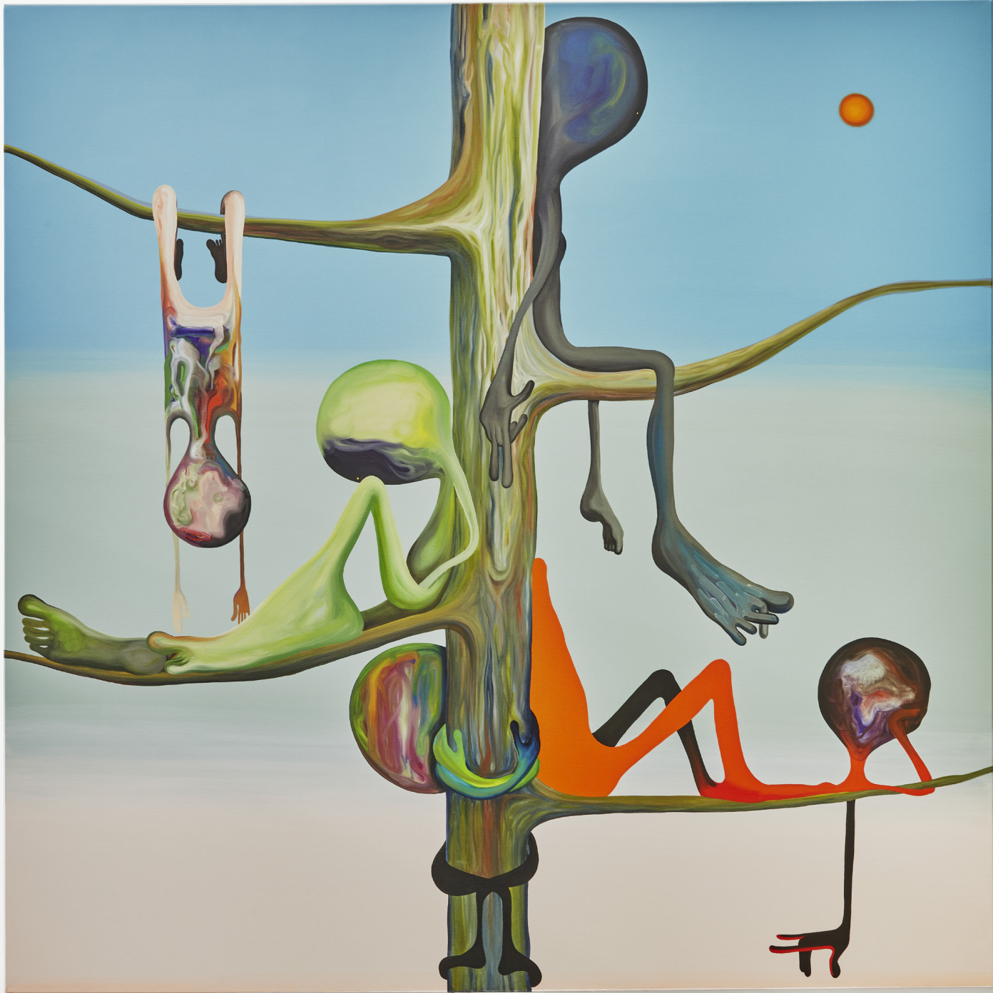
CONTEMPLATION SUR BRANCHE 180x180cm / Huile sur toile / 2021