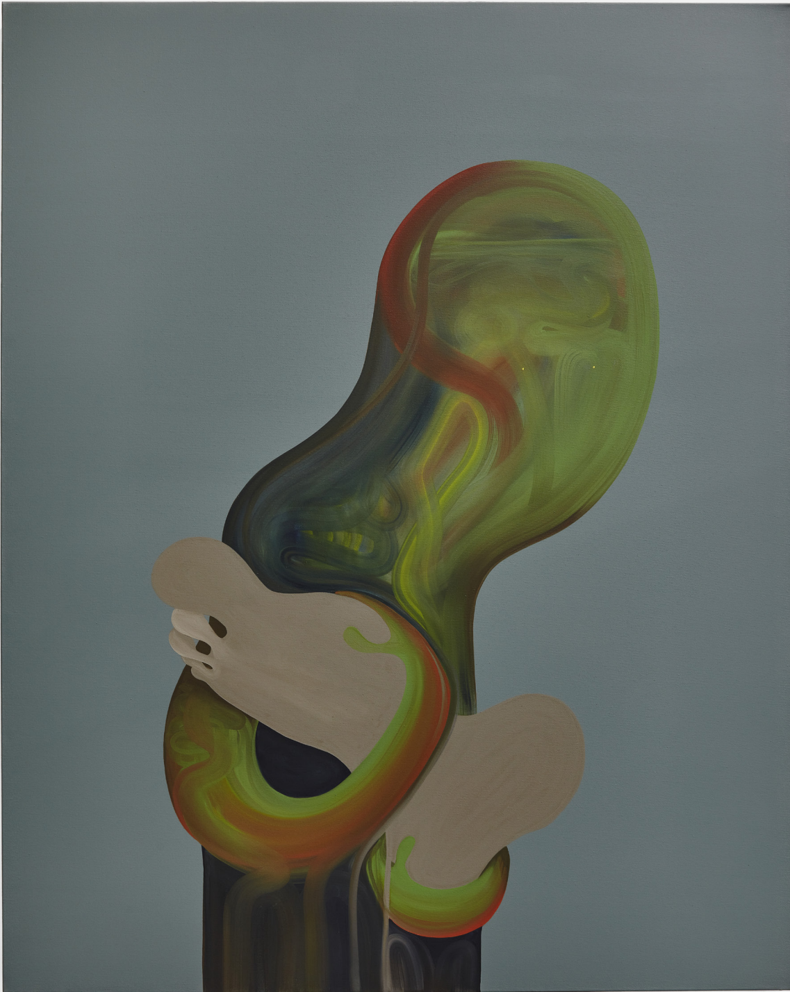
PRENDRE SON PIED / 120x150cm / Huile sur toile / 2021