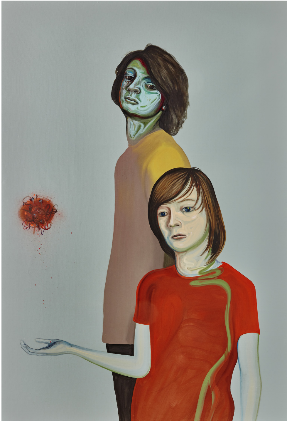
MARIUS & FÉLIX / 190x170cm / Huile sur toile / 2021