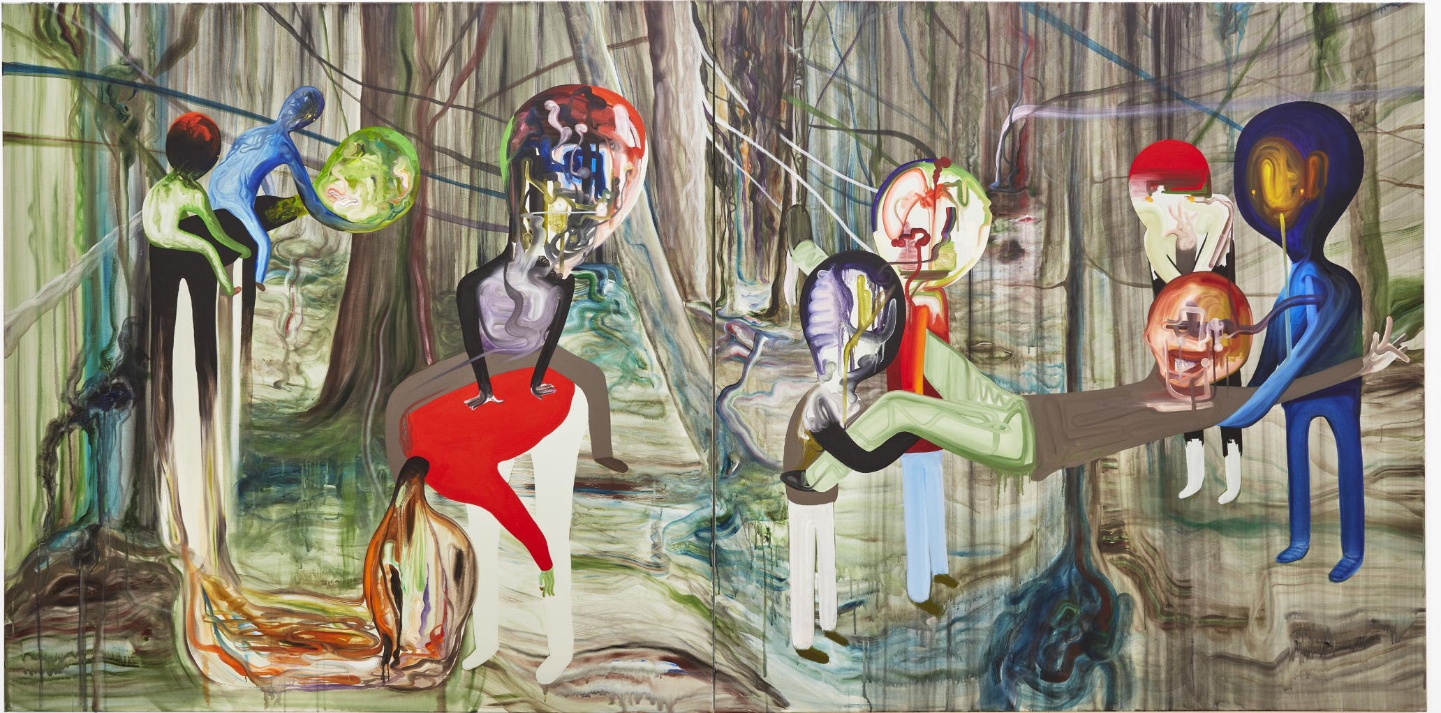
JEUX D'ENFANTS / 180x360cm / Acryl & Huile sur toile / 2021