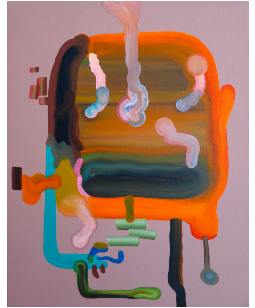
Culune 18x24 cm / Là bas 30x40 cm / Substitut 30x40 cm / Huiles sur toiles / 2024