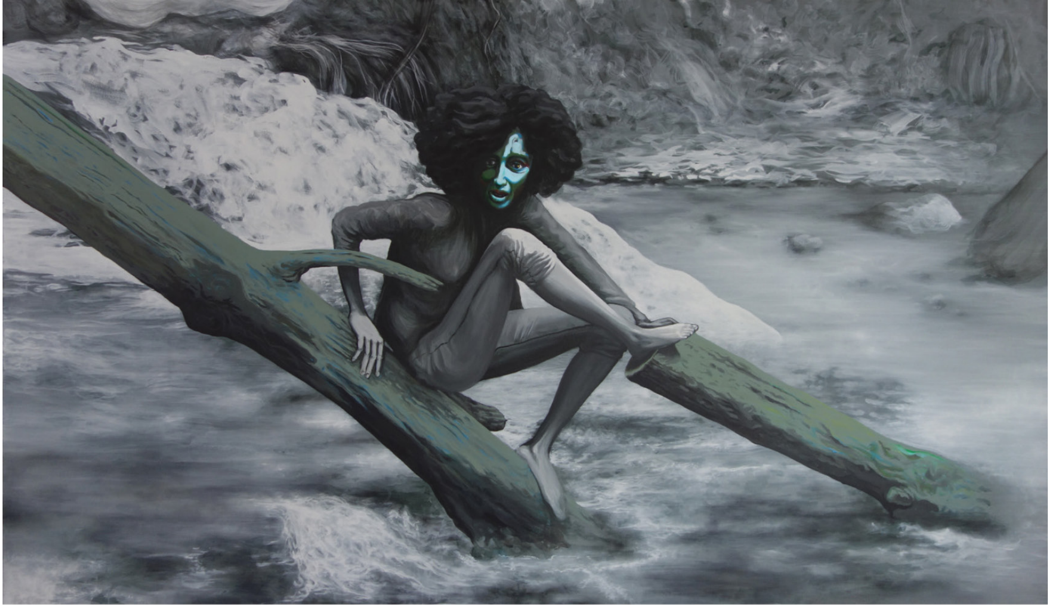
OLYMPIA SUR LIT D'ARENE 2020 / 240x140 cm / Acryl on canvas