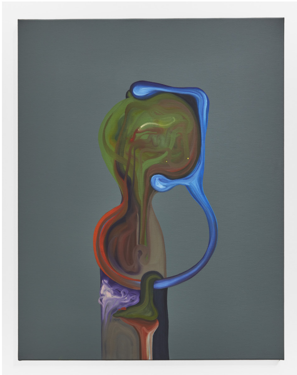
POING LIÉ / 70x90 / Huile sur toile 2021 SERRE TÊTE / 70x90 / Huile sur toile 2021