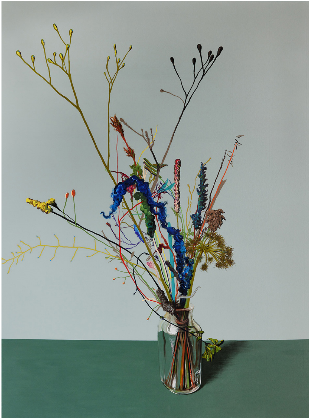
C'EST LE BOUQUET, huile sur toile, 200x150cm, 2021 Achat du Musée des beaux-arts de La Chaux-de-Fonds

Nourrie de références à des événements intimes comme extérieurs, la peinture de Tenko s'articule autour d'éléments narratifs ancrés dans l'inconscient collectif.