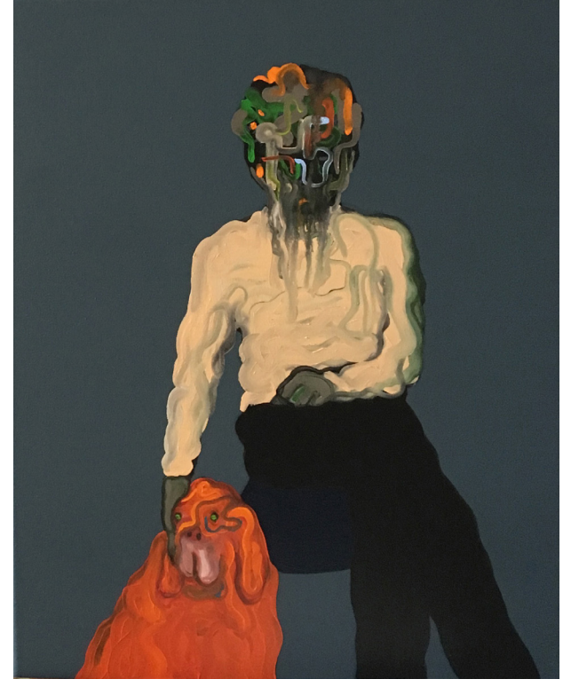
MAÎTRES ET CHIENS 2019 / 40 x 50 cm / Oil on canvas