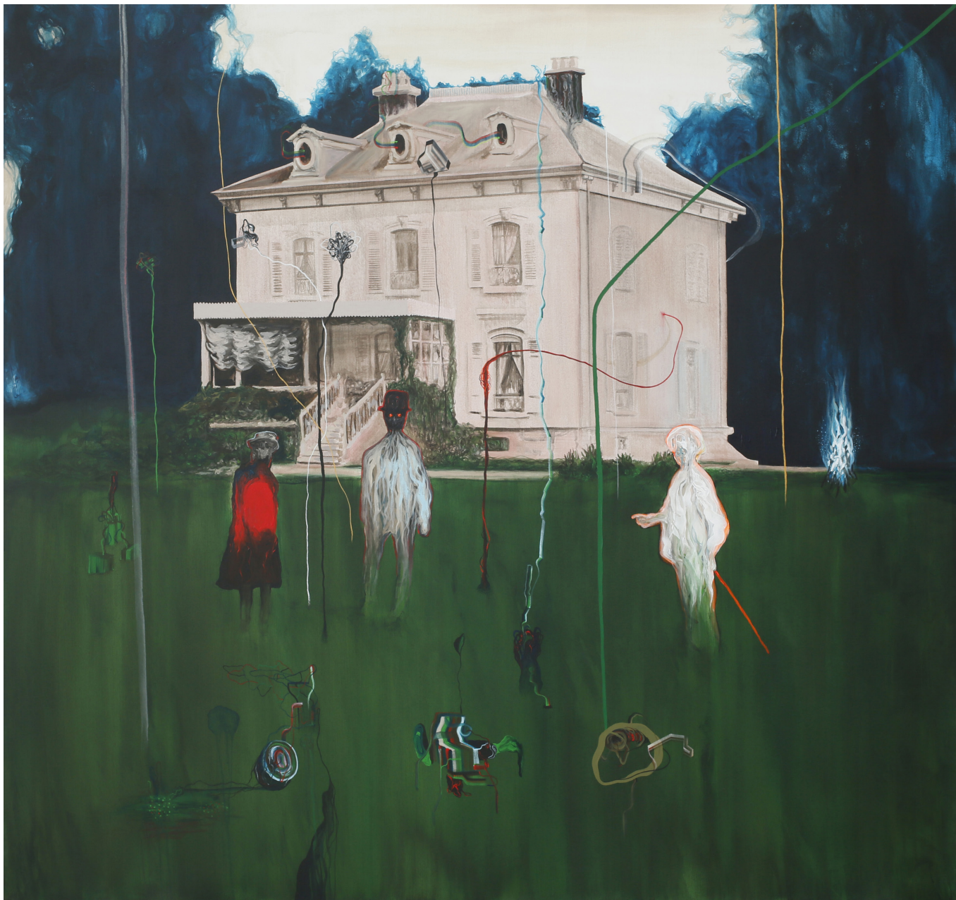
L'EXODE DE L'ILLUSION BOURGEOISE Tenko 2016, Acrylique sur toile, 180 x 180 cm. Collection du Musée des Beaux Arts de La Chaux-de-Fonds.

Avec un style singulier entre figuration et abstraction, Tenko manie l'écriture automatique autant que la narration hallucinée. Lutte des classes, bribes autobiographiques, géométrie, organes, nature et portraits obsédants sont autant d'éléments récurrents dans ses peintures et ses dessins.