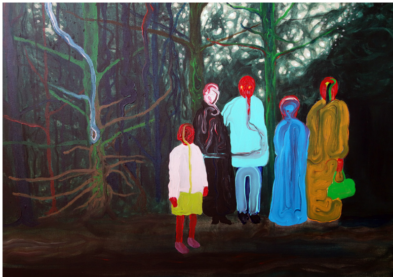
SANS TITRE & JEU AU JARDIN / 60x80cm 2016 / acrylique sur toile À LA FAVEUR DE L'OMBRE / 180 x 100 cm 2015 / acrylique sur toile