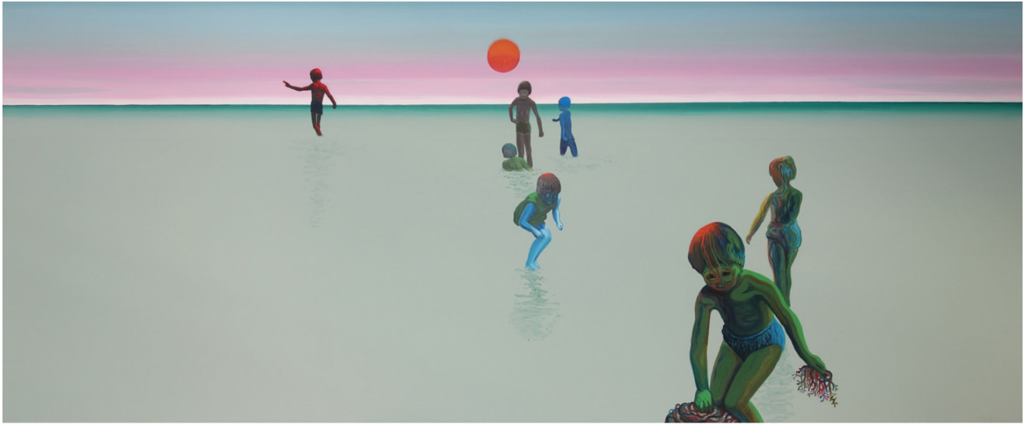
MIRAGE / 200 x 65 cm / Huile sur toile / 2019 / Commande du canton de Neuchâtel pour l'école Pierre Coulerly de La Chaux-de-Fonds