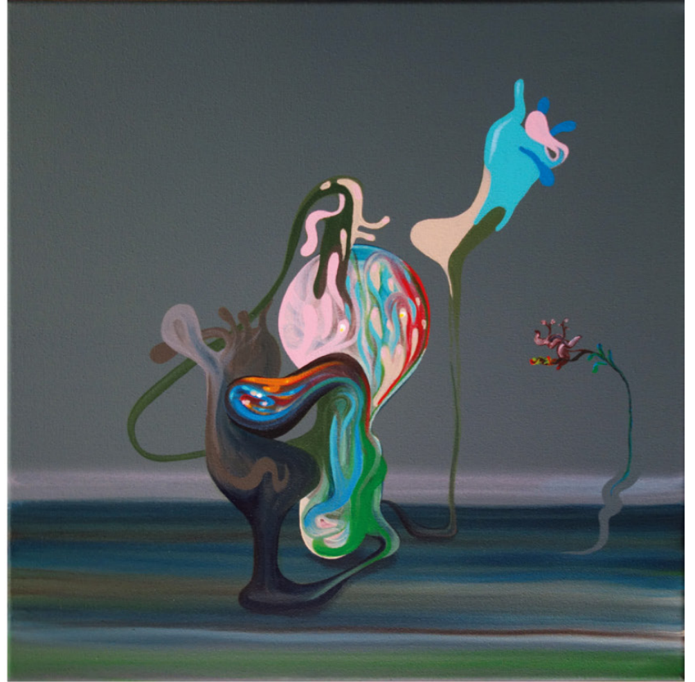
OTIUM 1-2 / 32 x 32 cm / Acrylique sur toile / 2021