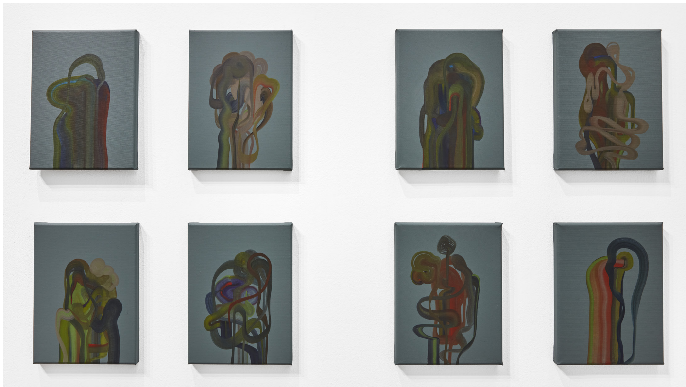
RHIZOME 9-10-11-12-13 / 18x13cm / Huile sur toile / 2021 RHIZOME 1-2-3-4-5-6-7-8 / 24x18cm / Huile sur toile / 2021