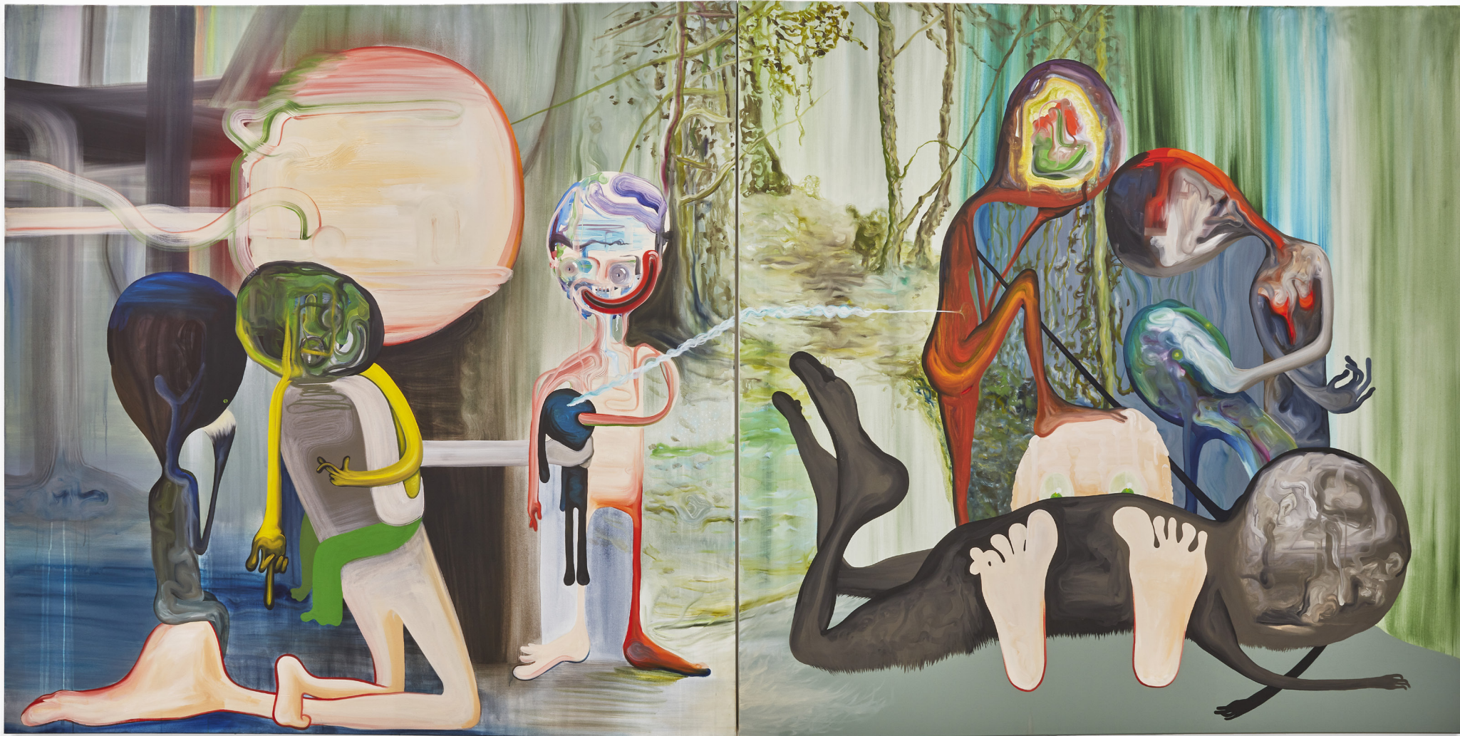
RASSEMBLEMENT AHURI / 180x360cm / Acryl & Huile sur toile / 2021